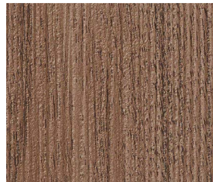
TH 32555 (P.113) NEW ウォルナット板証 eセコウ