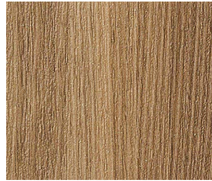
TH 32659 NEW ウォルナット板証 eセコウ