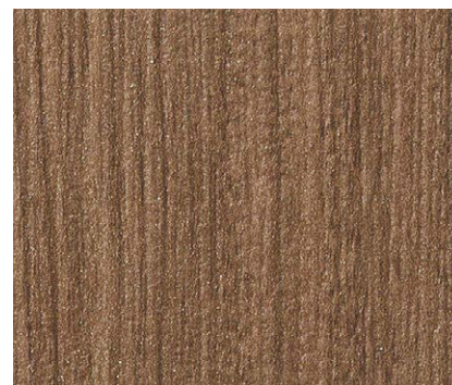
TH 32660 ウォルナット板証 eセコウ