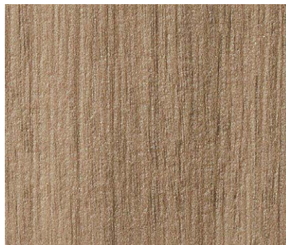
TH 32657 ウォルナット板証 eセコウ