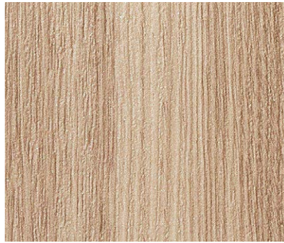
TH 32656 NEW ウォルナット板証 eセコウ