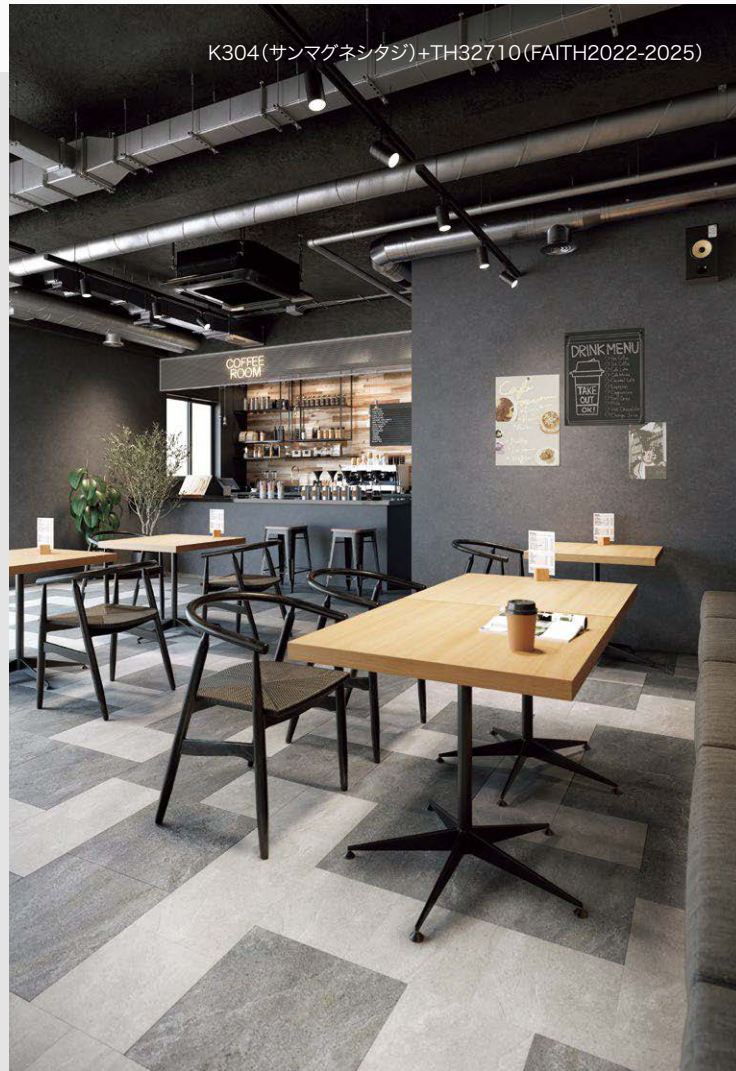
K304 (サンマグネシタジ)+TH32710 (FAITH2022-2025)