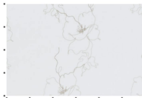
EK8001 のパターン写真 (1目盛り10cm) 柄は刺繍によって表現されています。