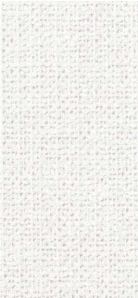
SGM1282 NEW S 4,570円/㎡ 4,200円/m 巾92cm 準不燃 防火種別 2-3