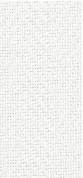
SGM1284 NEW SS 5,090円/㎡ 4,700円/m 巾92.5cm ↔ 2.5cm 準不燃 防火種別 2-3