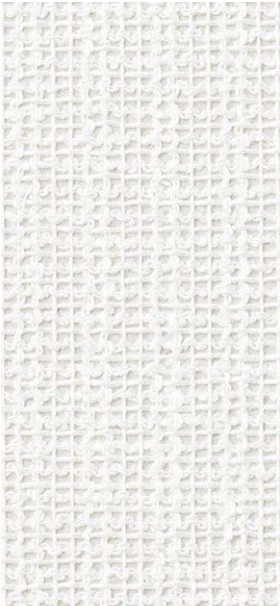
SGM1283 NEW S 4,570円/㎡ 4,200円/m 巾92cm 準不燃 防火種別 2-3