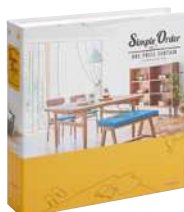
シンプルオーダーvol.1

窓辺のスタイルを提案するスタイリングブック。縫製仕様や、タッセルやトリムなどのカーテンアクセサリーも充実。