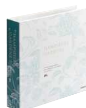
ハンシャガーデンズ-EDA-

ドレープとレースをそれぞれ“ワンプライス”で価格設定したオーダーカーテンの見本帳。