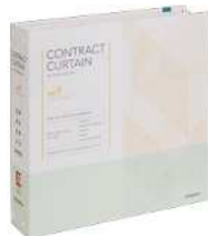
コントラクトカーテンvol.9

ロールスクリーンやパーチカルブラインド、木製ブラインドなどメカタイプの窓まわり商品を1冊に収録した見本帳。