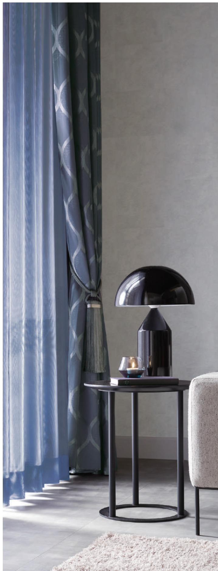
壁紙 SGB2321 (P.130)

カーテン SC8422・レース SC8717 (2021-2024 STRINGS)