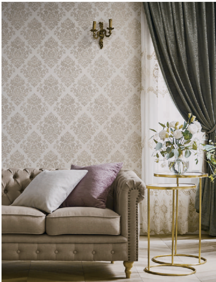
壁紙 SGA2480 (P.183)

カーテン SC8294・シアーカーテン SC8620 (2021-2024 STRINGS)