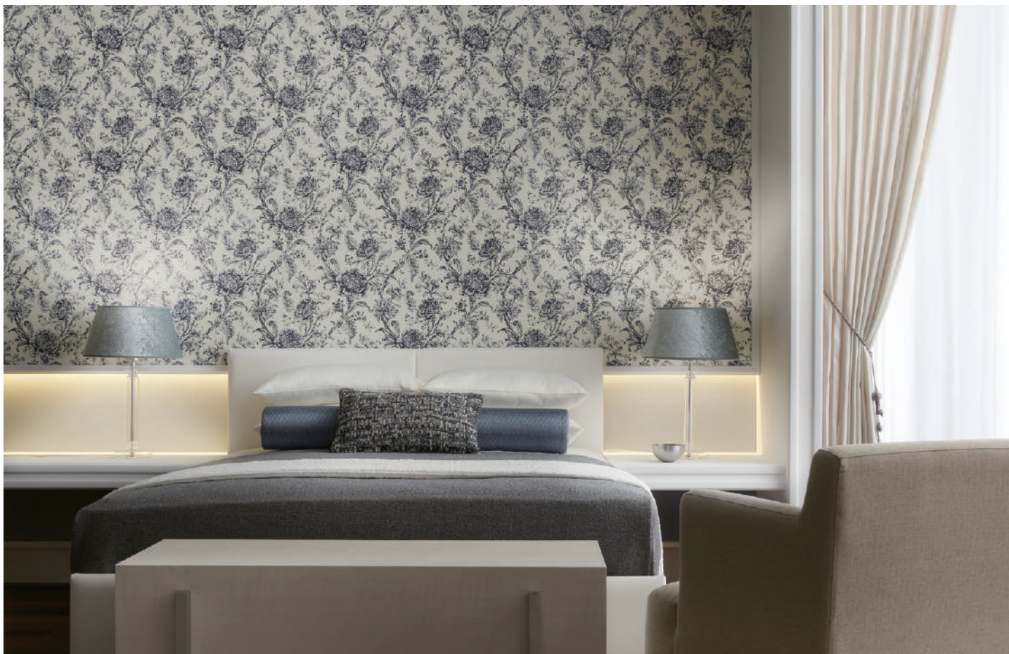
壁紙 SGA2477 (P.182)

カーテン SC8050・シアーカーテン SC8690 (2021-2024 STRINGS)