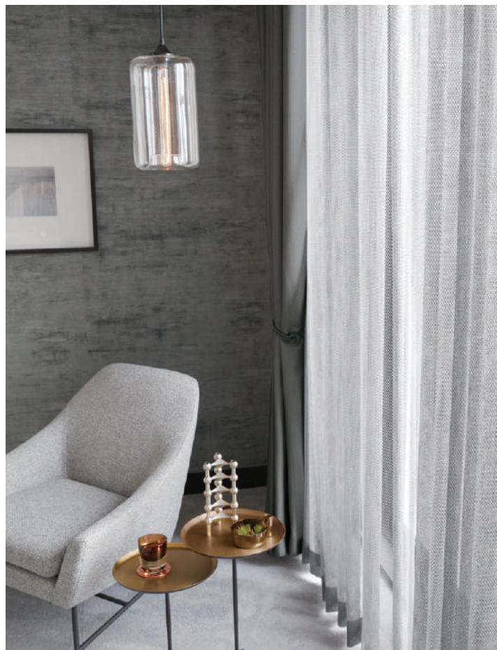
壁紙 SGB2365 (P.150)

カーテン SC8482・レース SC8718 (2021-2024 STRINGS)