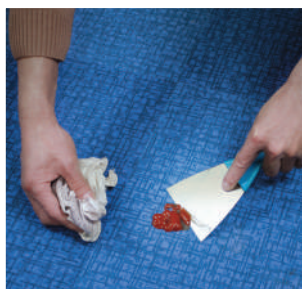
A.まず最初にスクレイパーなどで出来るだけ汚れを掻き集めて取り除いてください。