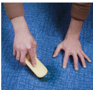
B.水(必要に応じて少量の洗剤)を用いて、ブラシなどで汚れた部分を十分に擦り、汚水を雑巾などで吸い取ってください。