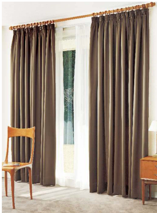
ギャザーカーテン