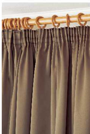
ギャザーテープを使用 (約2.5倍ヒダ)